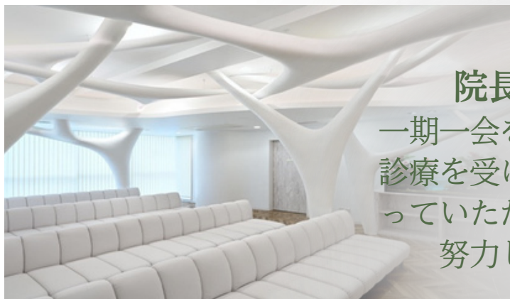
患者様が快適にお過ごしいただける環境