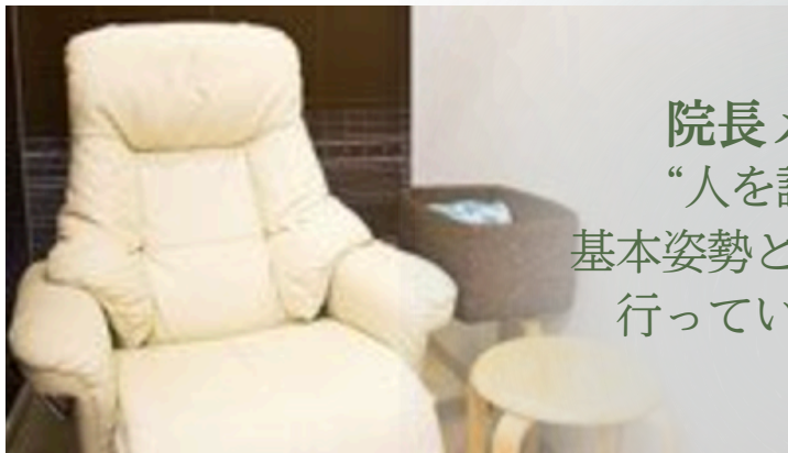
リラックスできる専用チェア完備

院長メッセージ “人を診る”ことを 基本姿勢としたがん診療 行っていく所存です。